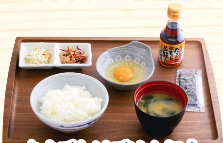
たまごかけごはん朝食 320円