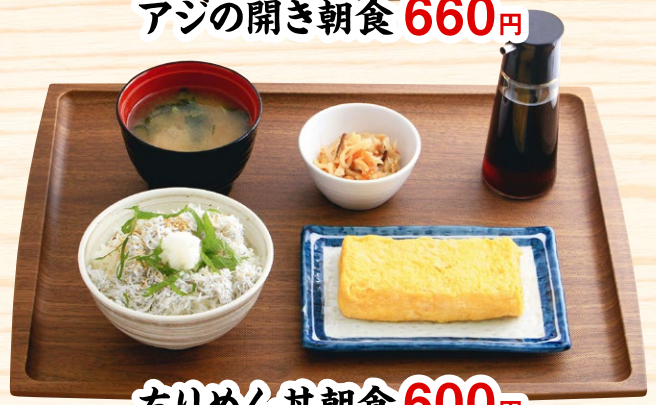
ちりめん丼朝食 600円