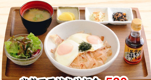
半熟目玉焼き丼朝食 530円