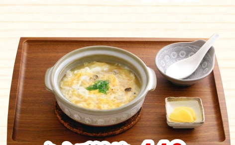
たまご雑炊 440円 とり雑炊 500円