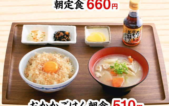
おかかごはん朝食 510円