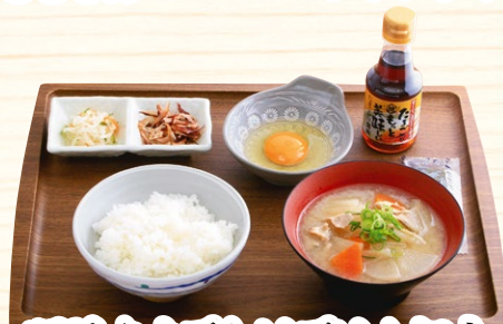
豚汁たまごかけごはん朝食 450円