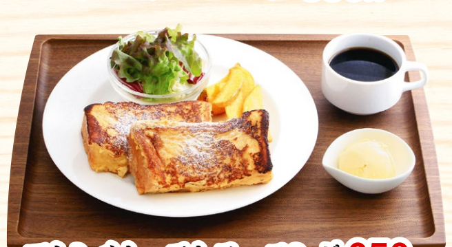
フレンチトーストモーニング 650円