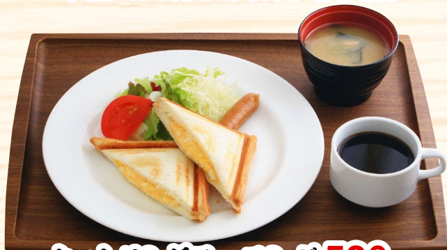
ホットサンドモーニング 580円