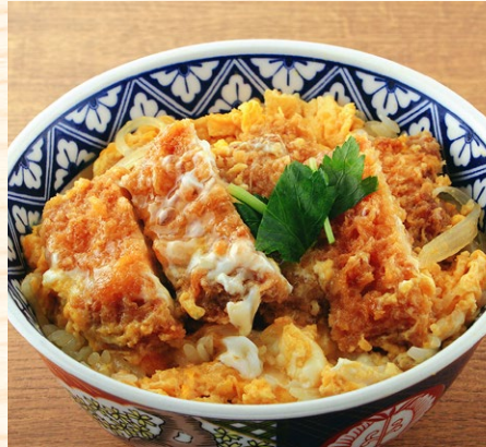
カツ丼 800円 ハーフ 500円