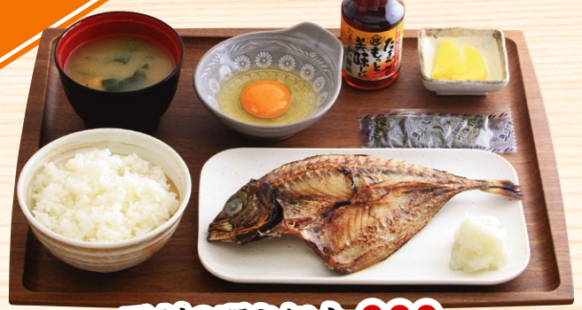
アジの開き朝食 660円