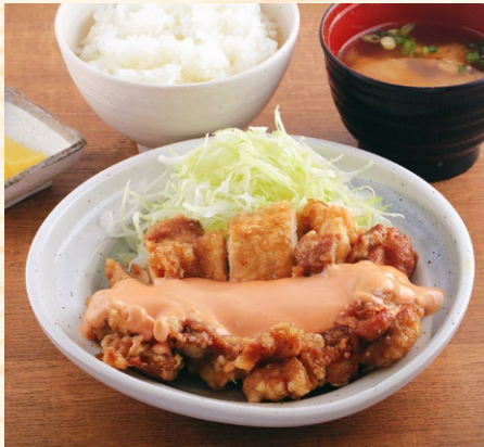
チキン南蛮定食 840円