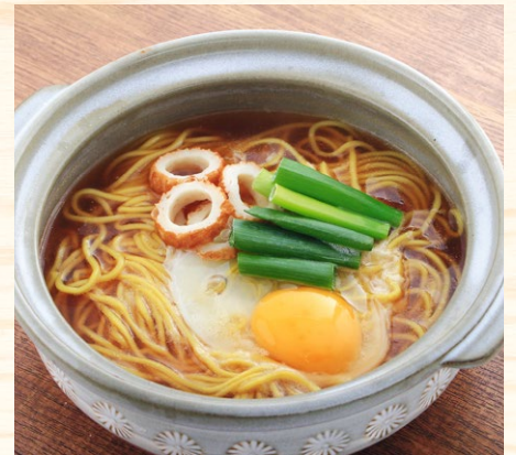
鍋焼きラーメン 690円