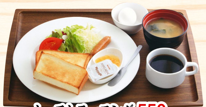
トーストモーニング 550円