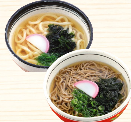
かけうどん・そば 410円