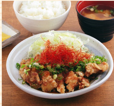
ユ-リンチ- 油淋鶏定食 840円