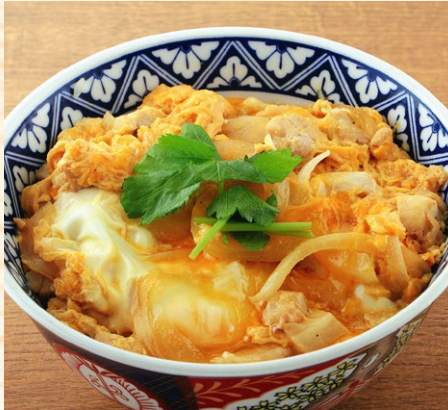
親子丼 660円 ハーフ 410円