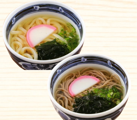
ハーフうどん・そば 250円