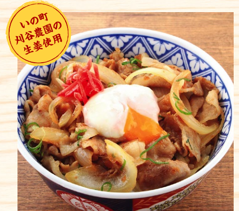
生姜焼丼 720円 ハーフ 470円