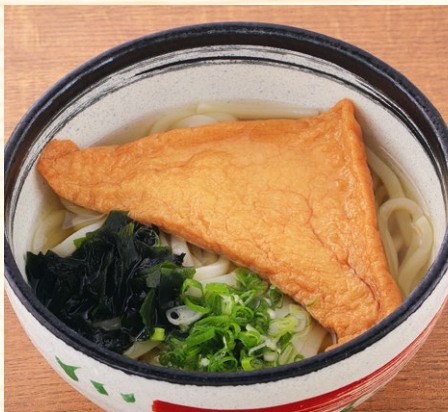
きつねうどん・そば 510円